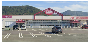
[その他][その他]くらし館