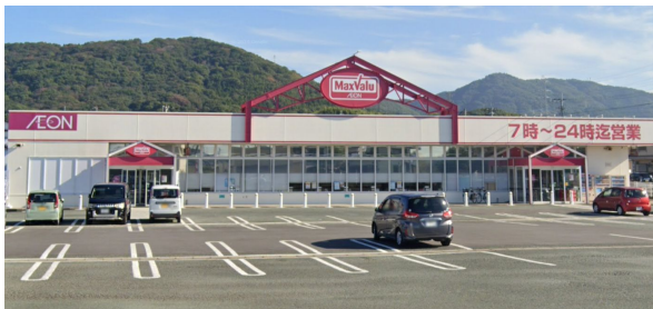
[その他][その他]くらし館