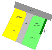
分譲区画図の1号地