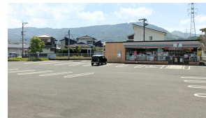
[その他][その他]コンビニ