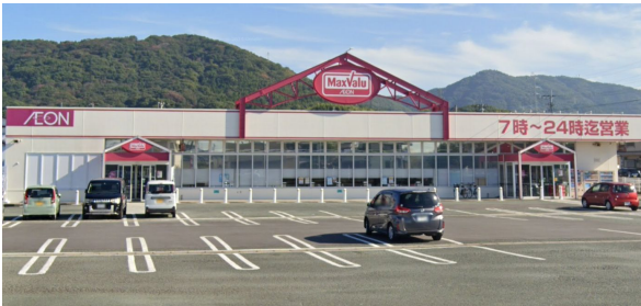
[その他][その他]くらし館