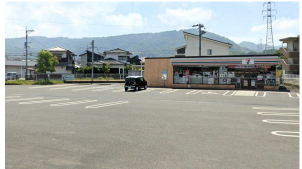
[その他][その他]コンビニ