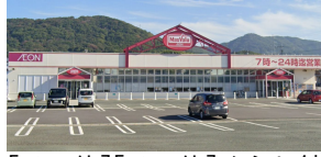
[その他][その他]くらし館