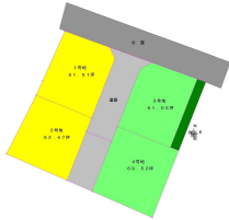
[間取り図・図面][区画図] 分譲区画図の2号地