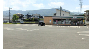
[その他][その他]コンビニ